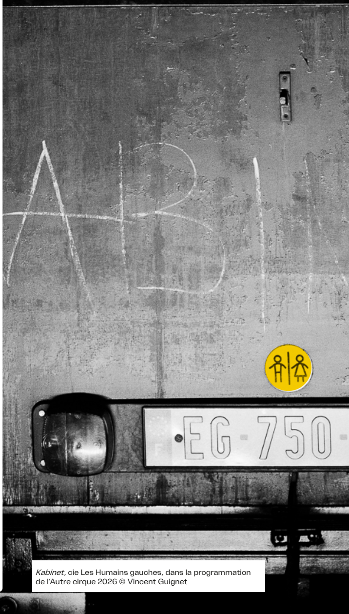
Kabinet , cie Les Humains gauches, dans la programmation de l'Autre cirque 2026