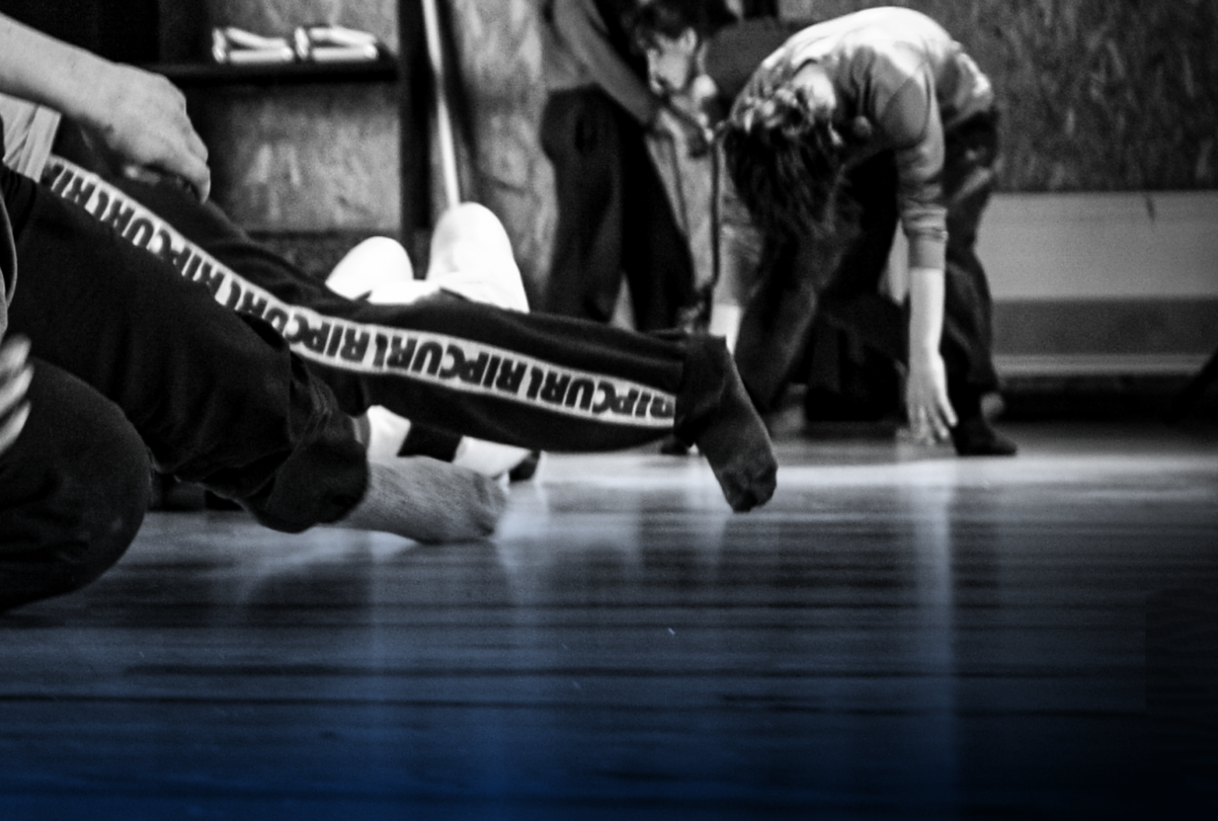
Stage de danse avec Oxyput cie, mars 2023